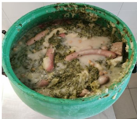
Slika 3: Ostanek hrane pri kosilu na OŠ Antona Globočnika Postojna (maj, 2023)

Pri kosilu pa je količina zavržene hrane kar precejšnja, in sicer v povprečju 88g/ učenca. Na sliki lahko vidimo skoraj napolnjen 50 kg sod z ostanki hrane od kosila.