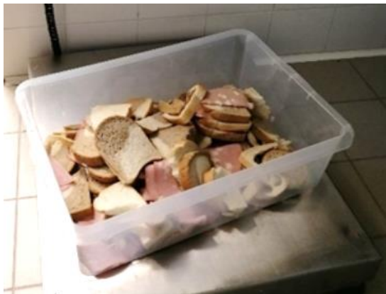
Slika 2: Zavržena hrana pri dopoldanski malici na OŠ Antona Globočnika Postojna (maj, 2023).

Iz preglednice 2 je razvidno, da je količina zavržene hrane pri dopoldanski malici nizka, in sicer 5g/ učenca. Kar nakazuje na to, da večina učencev ne zajtrkuje in da so do malice lačni in jo pojedjo. Nakazuje pa tudi na to, da učenci radi pojedjo malico, ki vsebuje salamo ali šunko.