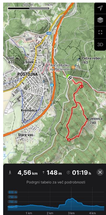
»Zemljevid aktivnosti 3d«

Zaradi varnosti in simulacije lova so tarče skrite izven glavne poti. Da je tarča v bližini nas opozori logotip tarče, na v tla zabitem količku ob glavni stezi. Tekmovalec poišče žival - tarčo, se postavi na označeno mesto za strel ter poskuša zadeti tarčo. Z vsako od zadetih živali se fotografira – naredi selfie, kot dokaz za svoj uspeh.