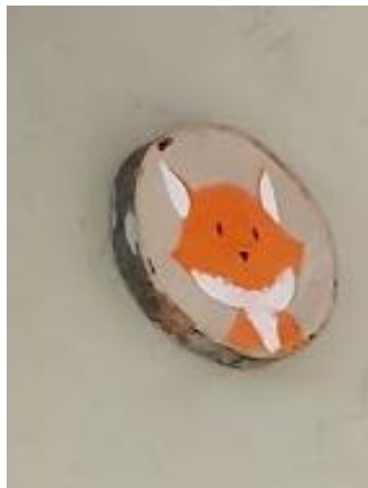
»Lisičkina medalja«