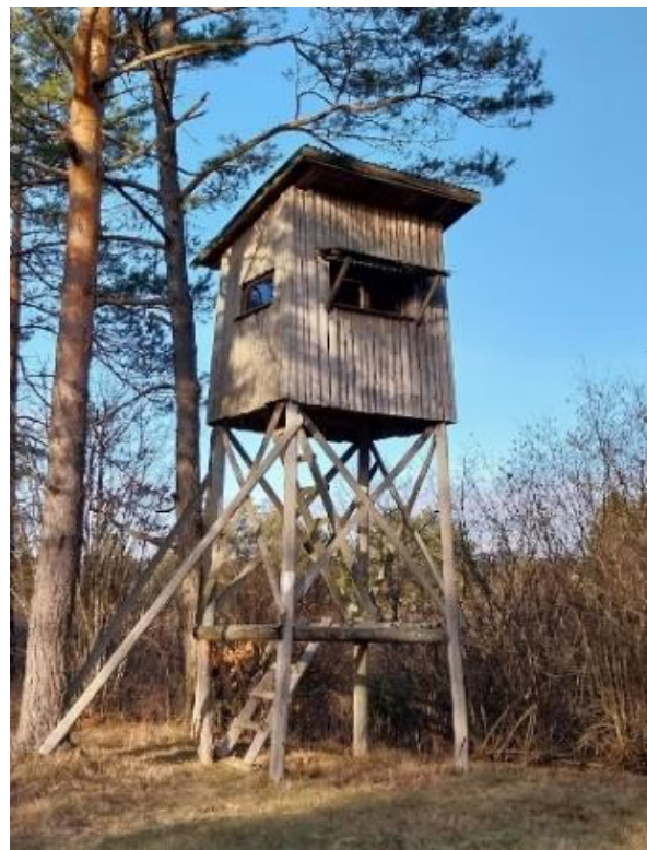
»Lovska preža«

Poseben način lova je skupni lov, pri katerem je uspešnost odvisna od sinhronega pogona med lovci in lovskimi psi. Uplenjeni divjadi na levo pleče položijo zeleno vejico kot 'vejico